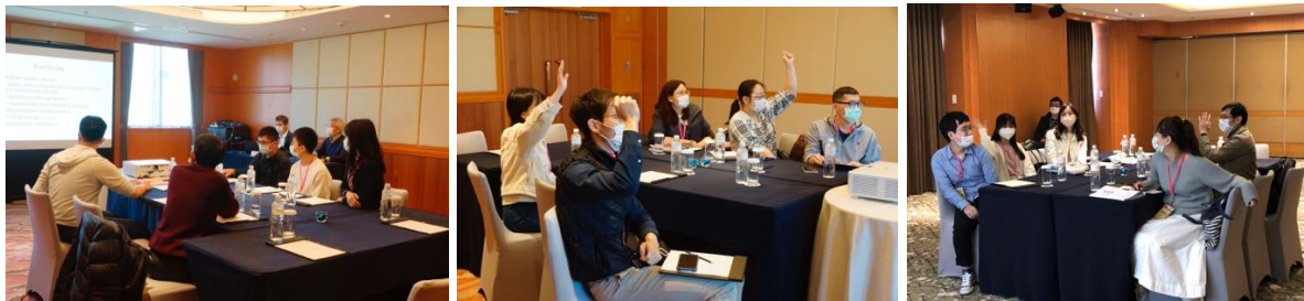
課程剪影：各組學員搶答身影

第二天的個案討論共有八個個案，透過搶答的方式進行。其中，除了偏頭痛的章節，其他原發性頭痛，包含叢發性頭痛、其他三叉自律神經痛 (TACs)、三叉神經痛 (TN)、雷急性頭痛的鑑別診斷與因腦壓變化引起的頭痛。透過這些個案討論，講師們也提供了許多快速鑑別這些頭痛的方式。透過詳盡的討論與解說，這八個個案都讓大家獲益良多。