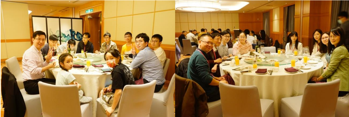
活動剪影：晚宴相聚，師生互動

頭痛大師學院不僅是向大師學習，也是與全國各區的醫師一起切磋，互相交流。透過這場盛會，我非常榮幸能認識來自各家醫院的夥伴。這些醫師們就像自己的手足一樣，以後病人就算不回來找你，你也能夠很有自信的推薦這些信任的醫師，繼續處理病人的問題。如同理事長常常提到，目前的藥物很多，「對自己的病人都要留最後一手」，我覺得，這屆大師學院的所有人，都可以作為彼此最堅強的後盾，永遠不怕沒有後援。( PS. 真的不行，最後一手就是請病人去基隆拜訪理事長 )